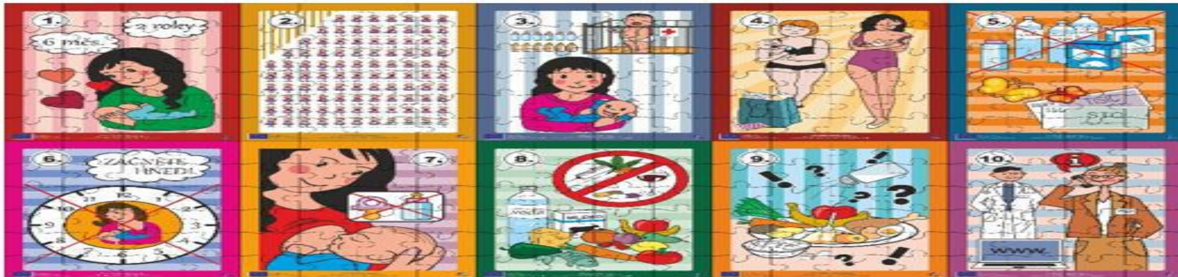
Oboustranný leták formátu A6